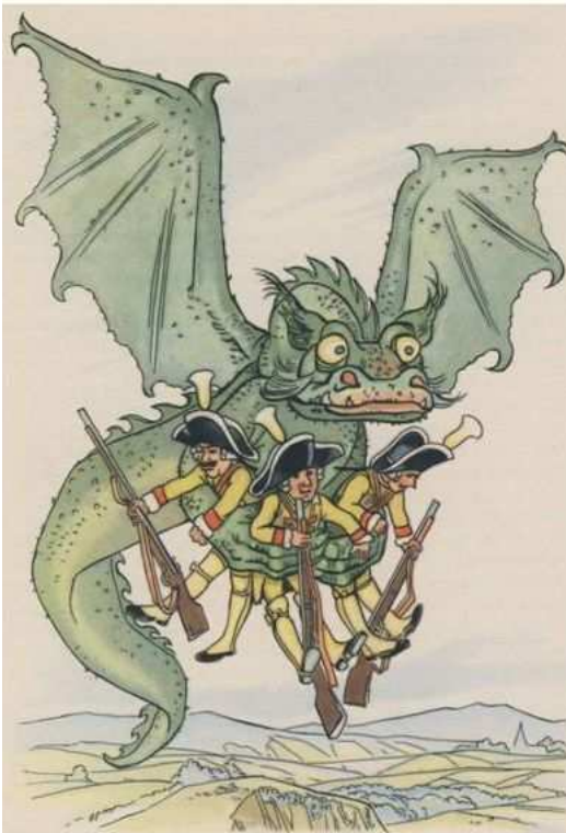
R. Koser-Michaëls, in: Märchen der Brüder Grimm (T.Knaur Nachf., Berlin, 1937), 59

Gottes Schöpfungs-"Woche" ist das Vorbild, die menschliche Arbeitswoche das Abbild, aber das macht aus den Schöpfungs-"Tagen" noch nicht automatisch 24-Stunden-Tage. Gottes Zeiteinheiten brauchen nicht mit den menschlichen identisch zu sein. Es gab ja auch das Sabbatjahr, das als "Sabbat" ein Jahr umfasste; auch das Sabbatjahr war für den Menschen da, aber kein Ruhejahr Gottes. 41