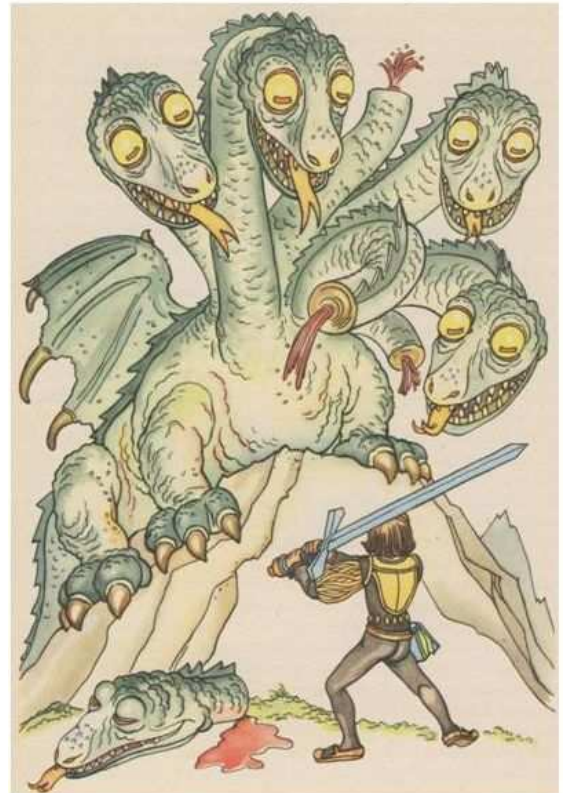
R. Koser-Michaëls, in: Märchen der Brüder Grimm (T.Knauer Nachf., Berlin, 1937), 383

Wie ist der Drache in Offenbarung zu deuten?