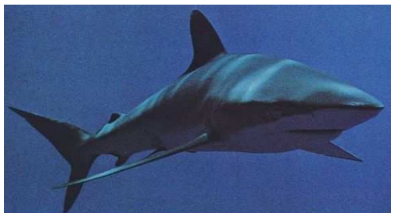
Haie können nicht Gras fressen

Schnelle Bewegungen, sei es in Wasser oder Luft, 49 bedingen Sinnesorgane zur Erfassung der Umwelt, Bewegungsorgane und Nervenleitungen samt einem zentralen Nervensystem zum Koordinieren der Bewegungen mit den Empfindungen, sowie eine Blutzirkulation zur schnellen Belieferung all dieser Organe mit Sauerstoff. Dieses ganze System entwickelte sich im Lauf der weiteren Evolution zu immer komplexeren Empfindungs- und seelischen Funktionen. Es heisst anschliessend (1,22):