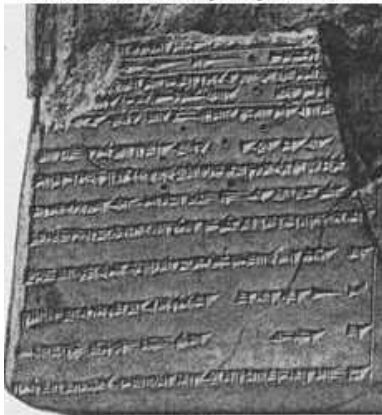
P.J.Wiseman, Die Entstehung der Genesis (Sonne u.Schild, Wuppertal, 1957), 48

Kolophon ["toledot"] eines Keilschrifttäfelchens